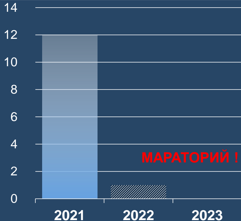
Плановые выездные документарные проверки